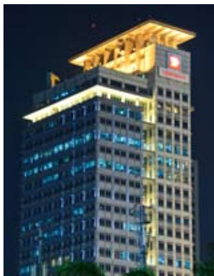
Hendy Widyanigrat PT Bahana TCW Investment