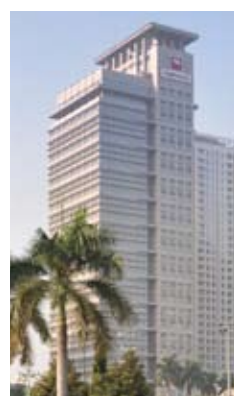
Nelwin PT Bahana Securities