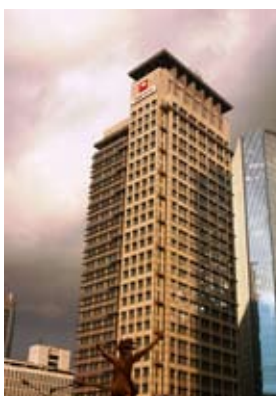
Diwangkoro Ratam PT Bahana Artha Ventura