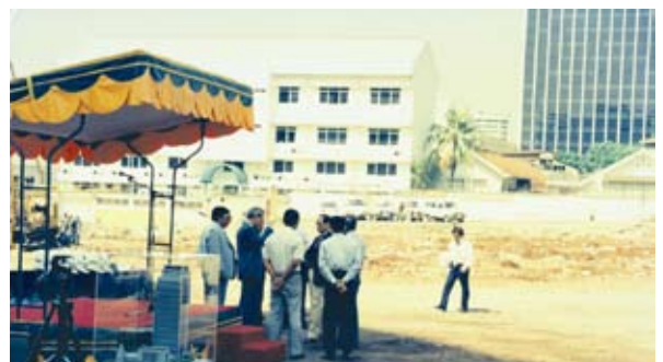
Ground Breaking Ceremony