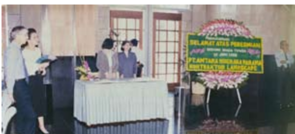
Peresmian Graha Niaga - 10 Juni 1993