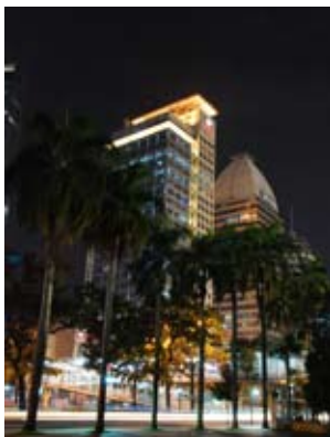
Egie Cipwinandy PT Bahana TCW Investment