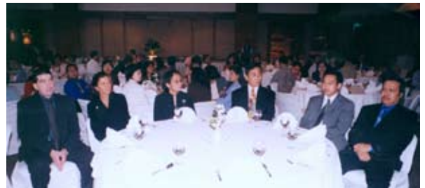
Ulang Tahun Graha Niaga Ke- 10