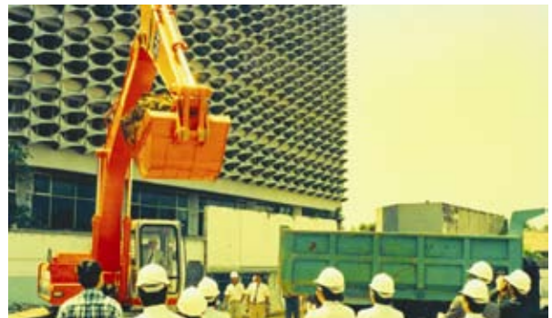
Ground Breaking Ceremony