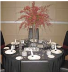
Creative Table Set Up