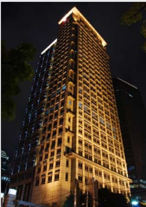
Juara 1: Azwar Djalil, PT CIMB Niaga

Kami mengucapkan selamat kepada para pemenang dan terima kasih kepada seluruh peserta Lomba Foto Gedung Graha Niaga.