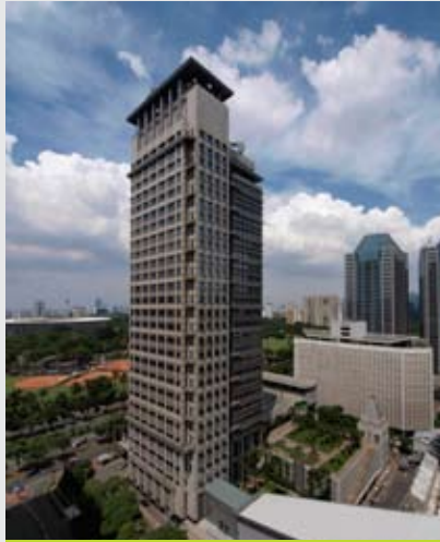
Juara 3: Aprison PT Medco Energi Internasional