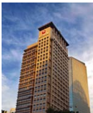
Zaki Financial Club Jakarta