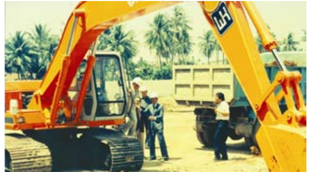
Ground Breaking Ceremony

antara granit, marmer, stainless steel, alumunium dan kayu pada gedung Graha Niaga mencerminkan soliditas dan keunikan tersendiri. Pemilihan material tersebut tidak hanya dari faktor estetika saja namun juga dari faktor durabilitas. Karena itulah meskipun sudah menginjak usia 16 tahun, gedung Graha Niaga tetap termasuk Grade A Building dan dapat bersaing dengan gedung-gedung yang berdiri belakangan ini.