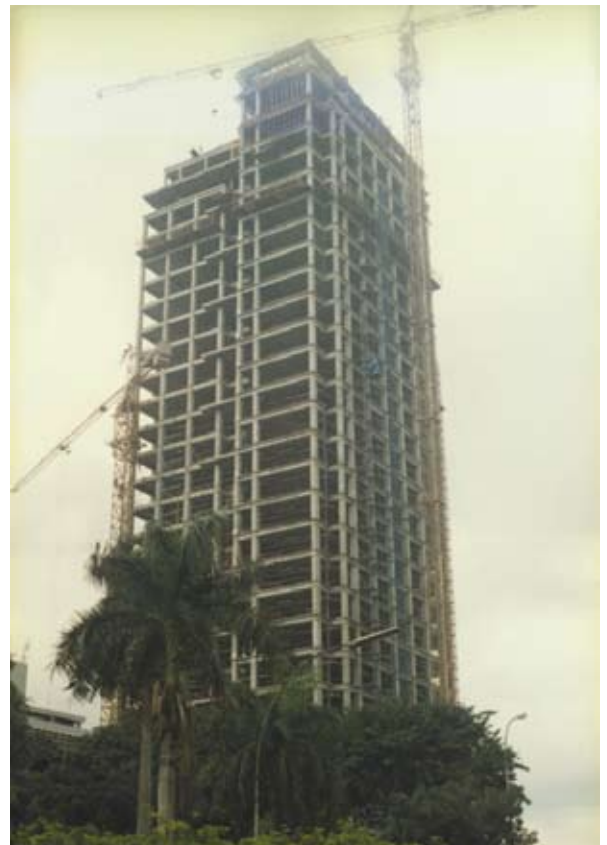
Masa Pembangunan Graha Niaga

Setiap hasil desain KPF merupakan kolaborasi arsitektur dengan pemilihan material yang mencerminkan citra gedung tersebut. Perpaduan material