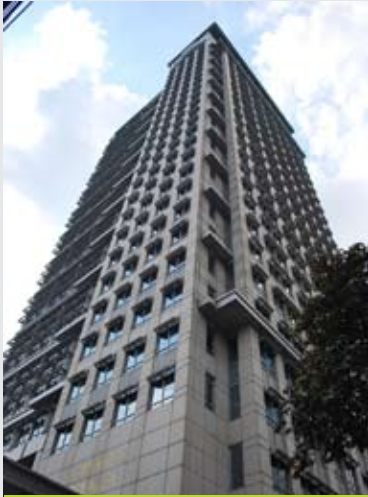
Juara 2: Nurkholis Hasbullah PT Bahana PUI