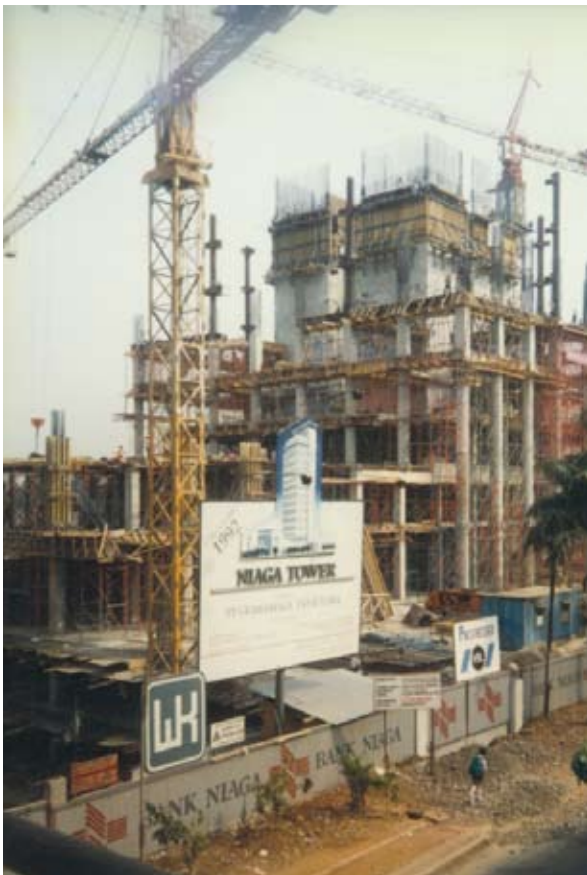
Masa Pembangunan Graha Niaga